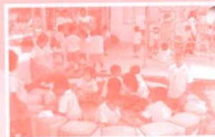
นำเล่นด้วยกับนิเทศฯ ของเล่นได้นับยะละเล่น