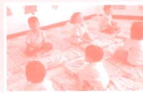
พิธีสวดมนต์เช้า