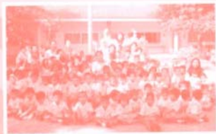
นิเทศงานภายในห้องของ กทม.บ้านเลข ศูนย์ที่ 2 ปละจำปีการศึกษา 2551 ค่ะ