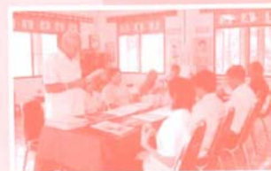
ถ่ายทอดการจัดการเรียนการสอนผ่านสื่อของครู กล่าวคือเน้นขั้นตอนการ