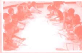
มีการถ่ายทอดจากท "ช่างชาวบ้าน" ทางช่อง 7 สี (ทำถนน ทุ่งรังสิตศรี) ออกอากาศเมื่อวันที่ 11 มิถุนายน 2551