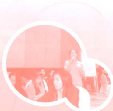
คุณครูที่หนู เป็นตัวแทนกลุ่มในการ เล่าประสบการณ์ การพัฒนาศูนย์สู่ความสำเร็จ