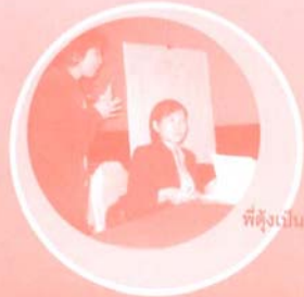
พี่ตุงเป็นกำลังใจให้น้องหนูอยู่ประจำ