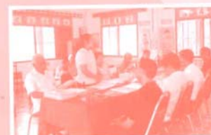
คุณครูสอนทำอาหารสำหรับเด็ก