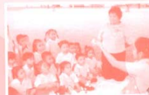
Lesson Cooking ครัว