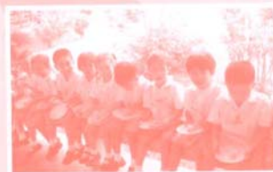
จัดตั้ง จากสาระวิชาของครู ๆ นำตามขั้นตอน